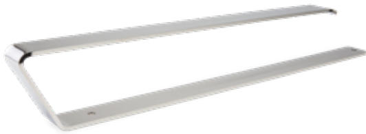
Avec : LAVA® Halti en acier inoxydable poli