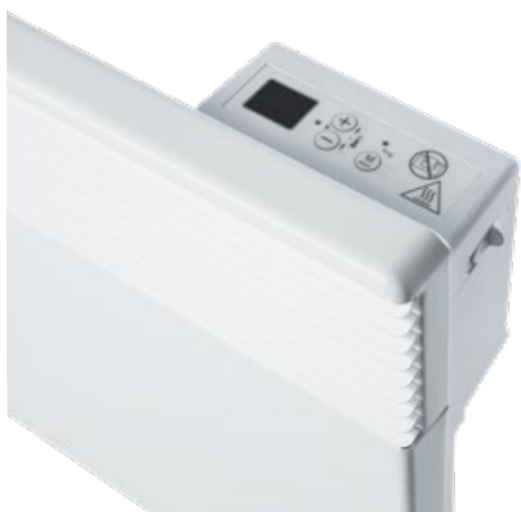
Thermostat électronique avec sécurité enfant

Le convecteur compact permet de chauffer rapidement les pièces à vivre, caves, toilettes, chambres à coucher et espaces de loisirs. Le modèle est également idéal pour les salles de bains étant donné que tous les appareils sont étanches aux éclaboussures. L'élément de chauffage monobloc réchauffe rapidement et efficacement l'air. Les grilles diffusent l'air chaud dans la pièce vers l'avant par convection naturelle, empêchant ainsi la décoloration du mur. Le thermostat électronique assure une mesure précise de la température ambiante et permet le réglage des 4 modes de fonctionnement : confort, économie d'énergie, protection antigèle et arrêt. Le thermostat peut être adapté aux besoins individuels à l'aide d'un programme hebdomadaire. Il optimise l'utilisation du chauffage en détectant la chute de température et répond à la directive d'écoconception LOT 20.