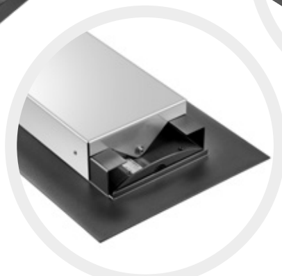
Faible profondeur de montage