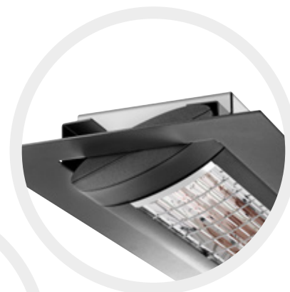
Inclinable jusqu'à 20°