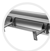
Arrière S3, avec fixation en T

* Attention : courant de démarrage plus élevé !