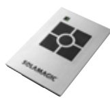
Télécommande à 4 canaux