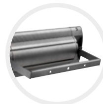
Arrière S1+, avec support