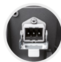
Câble de connexion S1+ et S3