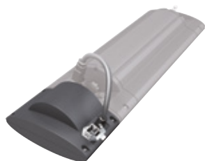
Module variateur sans fil SOLAMAGIC®