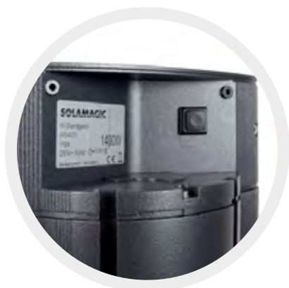
EIN/AUS Schalter auf der Rückseite