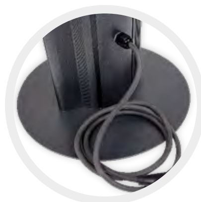
Steckerleitung 1,8 m