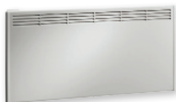
Konvektor Serie CP (400 mm)

Das Etherma Technik Team unterstützt Sie gerne bei der Dimensionierung der Heizung.